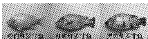
图 1 粉白、红斑、黑斑红罗非鱼

本实验所用红罗非鱼是由淡水渔业研究中心 2010 年从马来西亚引进,并在淡水渔业研究中心宜兴实验基地进行养殖驯化,选取的实验鱼为引进红罗非鱼的 F 2 ,平均体重为(400.32 ± 53.45)g,平均体长为(23.14 ± 5.74)cm。实验鱼已出现一定程度的体色分化,将红罗非鱼按体色划分为 3 种,分别为粉白(全身粉白色)、红斑(红斑面积超过二分之一且无黑斑)、黑斑(黑斑面积超过四分之一)红罗非鱼,见图 1。