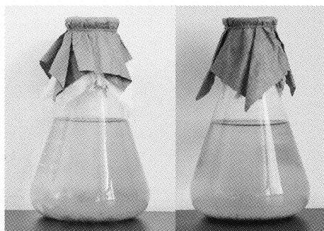
图2 海洋尖尾藻培养 Fig.2 Culture of O. marina