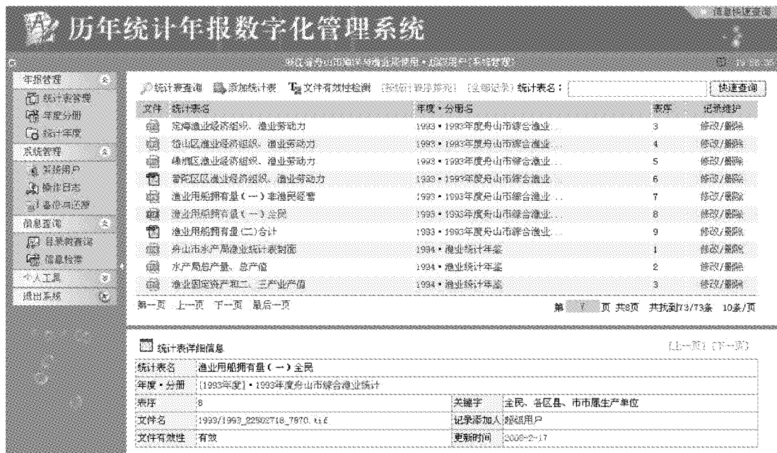
图 3 系统主界面

完备的信息检索方式能更好地共享网络上的各种资源。本系统可以根据统计年度、年度分册名、统计表名、关键字等字段组合检索需要的报表信息。除传统的检索方式外,系统还引入的树形检索方式。在树型检索的界面,报表按年度和分册归类 and 排序,使用户更方便地浏览所有需要的报表。传统的检索方式更适合检索某些符合条件的记录,而树形检索则使用户可以根据年报的顺序浏览和查找需要的报表。